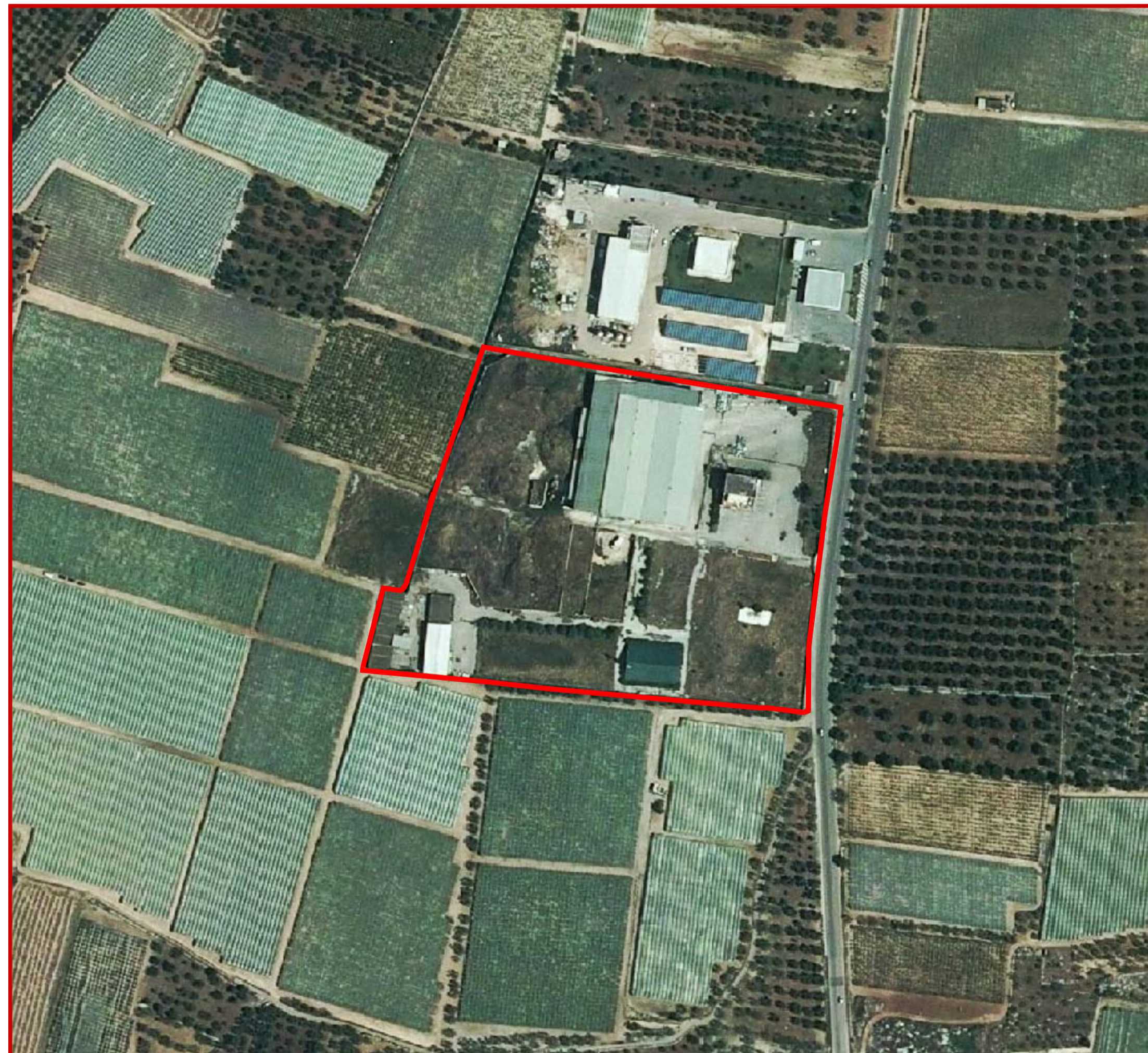
Ortofoto Scala 1: 2.000