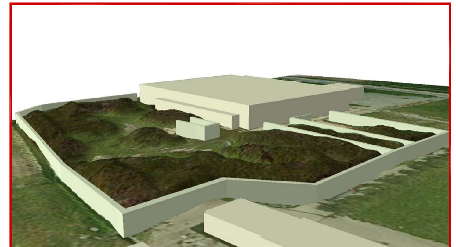
Elaborazione 3D dei luoghi