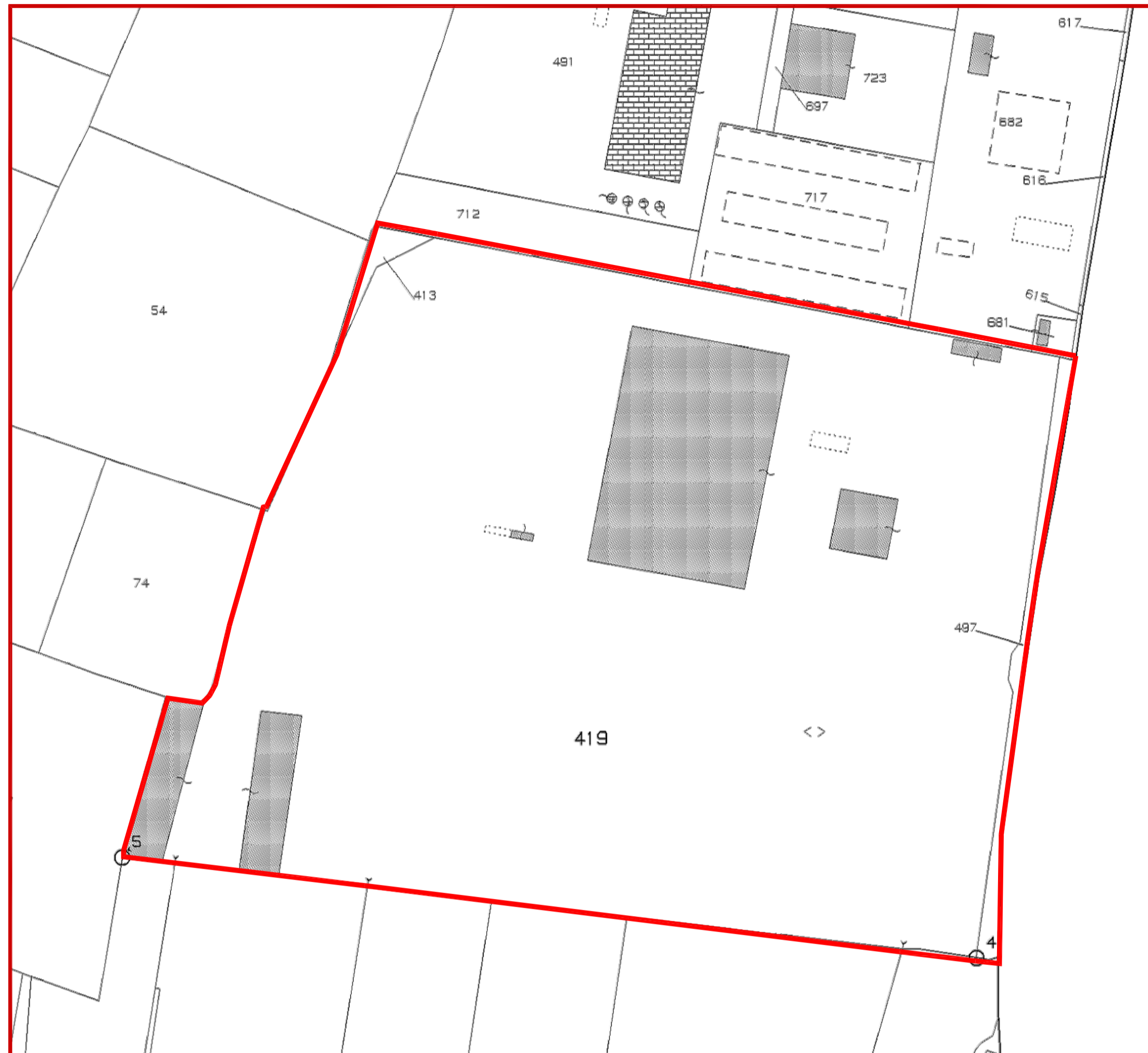
Stralcio Catastale del Comune di Adelfia Foglio 12 Particelle 413, 419, 497 Scala 1:1.000